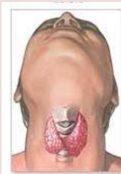
قبل از عمل